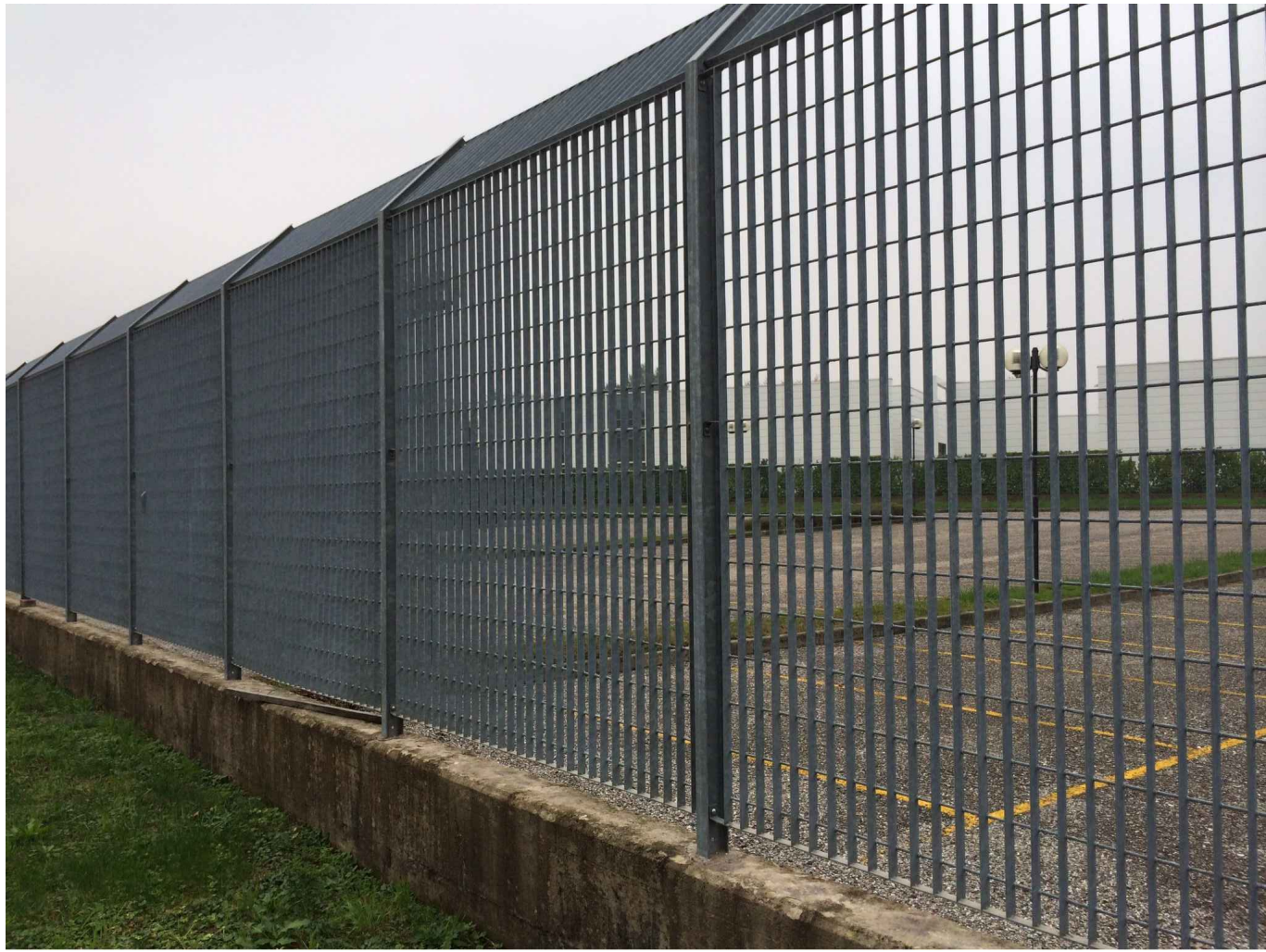
RIFERIMENTO FOTOGRAFICO BARRIERA IN RICHIESTA